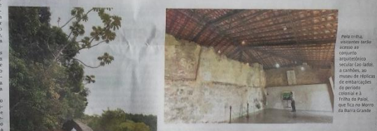
Trilha do Góes é mantida pela comunidade e leva à trilha em outro local, que volta a ser realizada a partir do mês de fevereiro, assim como o Projeto Quebra-gelo de artesanato e cultura no Museu.